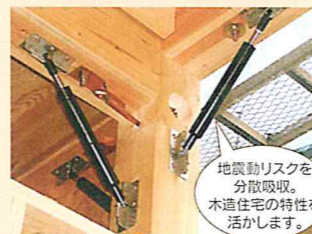
地震動リスクを分散吸収。木造住宅の特性を活かします。

地震や台風に備えて、全棟に制震システムを設置。従来の工法では耐震性が「ゼロ」とみなされていた木造住宅の開口部に構造補強材を設置し、さらに制震用オイルダンパーを取り付けることで、建物の強度を高め、揺れを減衰するという「二重の安心」で、住まいと住まう人をしっかり守ります。