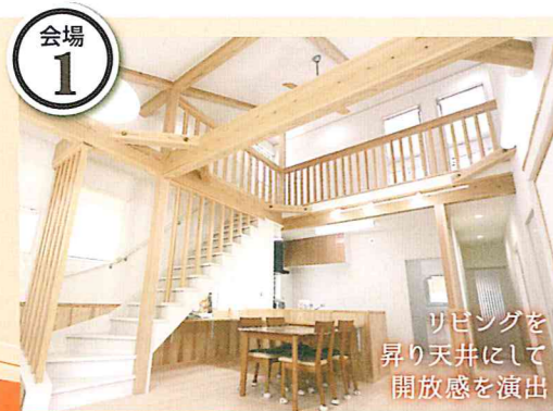
リビングを 昇り天井にして 開放感を演出